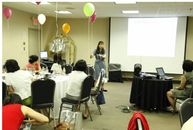
武红校友和大家交流返校感想