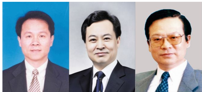
三位新当选院士（左起）詹启敏教授、赵玉沛教授、郎景和教授

经院校和院士推荐、两院评审，我院校詹启敏、郎景和两位同志当选中国工程院院士，赵玉沛同志当选中国科学院院士。截止目前，我院校已有两院院士27名，其中，中国科学院院士10名，中国工程院院士17名。